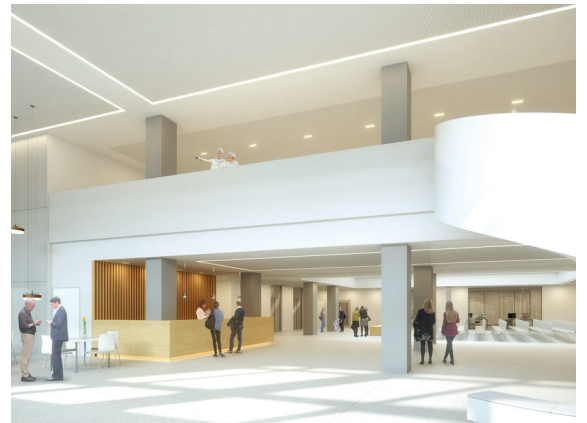
Renderings: © Heinle, Wischer und Partner | Freie Architekten