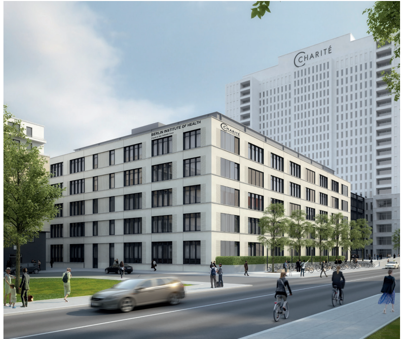
Rendering: © Heinle, Wischer und Partner | Freie Architekten